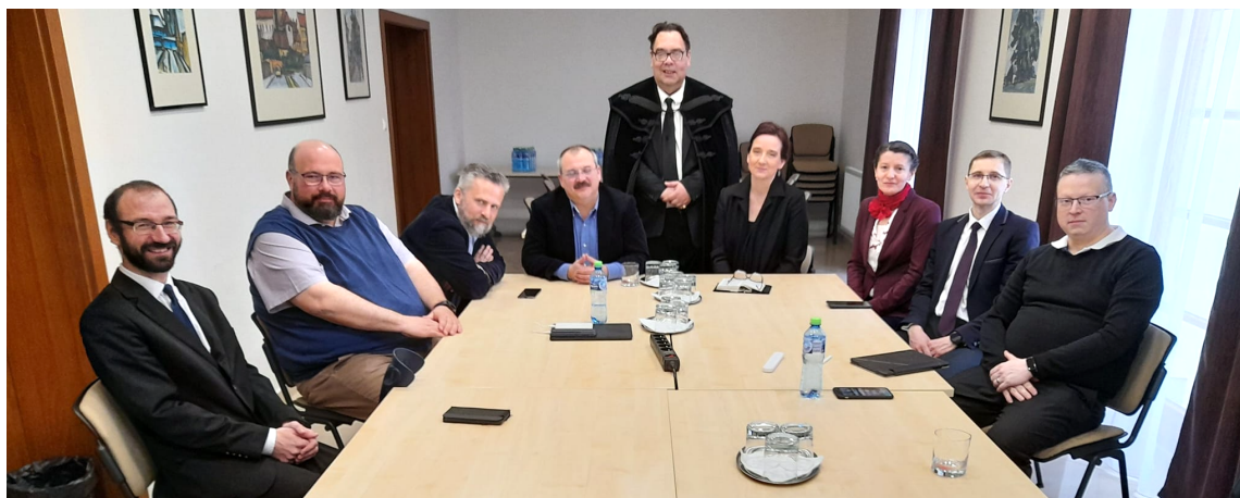
Koordináčná rada reformovaných diakonických organizácií v Karpatskej kotline (KMRDET) – Rimavská Sobota