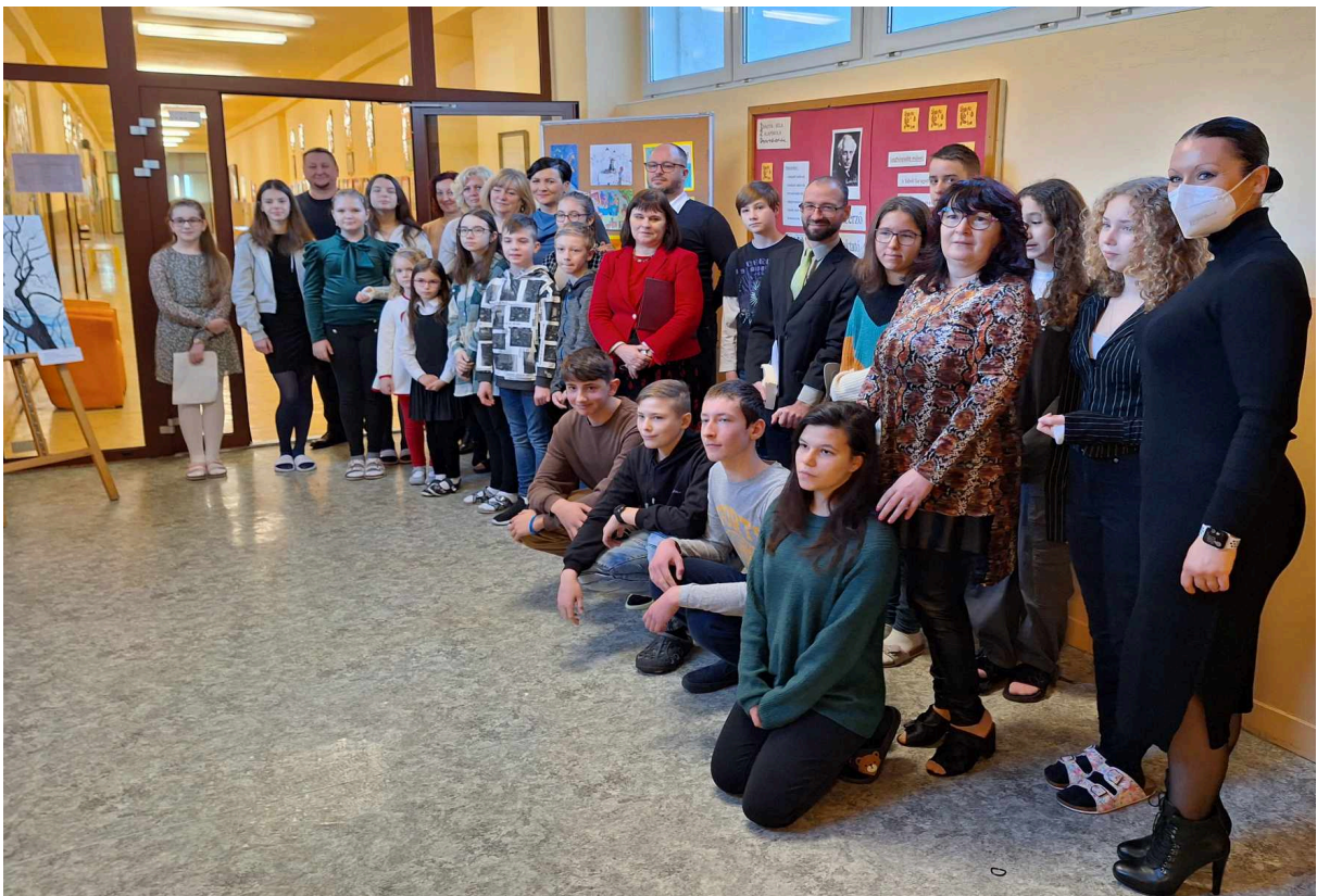
Účastníci vernisáže výstavy súťaže v kreslení