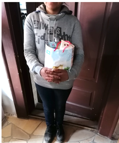
Taška ženskej lásky