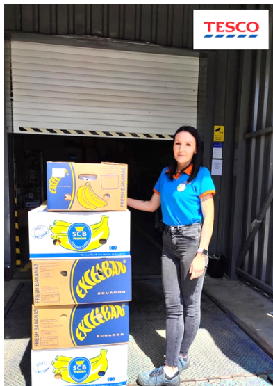
Potravinový dar (Tesco)