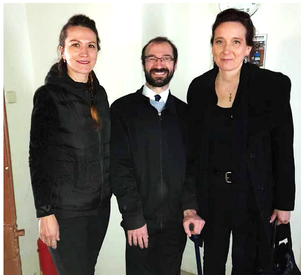
KMRDET – Rimavská Sobota